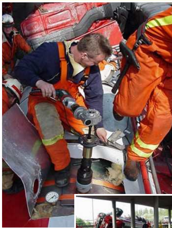
Sege, Ruotsi 2000/05/10 Kaatunut polttoöljysäiliö tyhjennettiin laitteella.